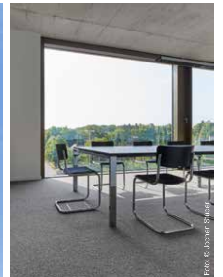
Kugelgarn® wurde im Besprechungsraum bis an die Fenster verlegt, deren Rahmen ein symbolisches Kreuz darstellen.