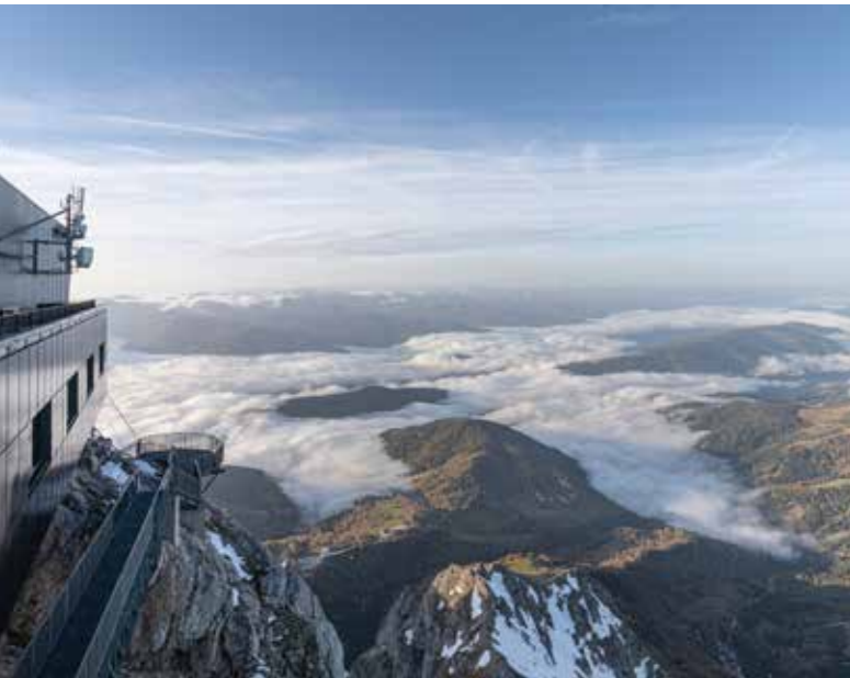
Le restaurant séduit non seulement par son aménagement intérieur, mais aussi par sa vue spectaculaire.

Le chantier a donné lieu à des interventions parfois spectaculaires: il a fallu, par exemple, hélitreuiller une grue, laquelle devait être régulièrement dégagée de la glace par un alpiniste pour des raisons de sécurité. La vue à 280 degrés qu'offre le nouveau restaurant sur les montagnes environnantes est également époustouflante.