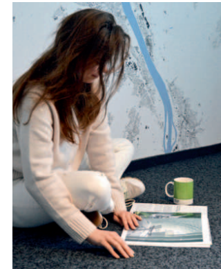
Ein neuer Pausenplatz entstand bei BauWerkStadt Architekten.