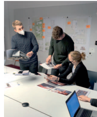
Das agn-Team bei der engagierten Farbauswahl