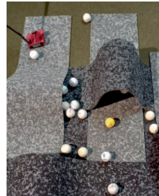
Bei Gütt Architektur brach der Spieltrieb aus.

Auf Einladung von AIT-Dialog und Fabromont wurden deutschlandweit InnenarchitektInnen und ArchitektInnen zu einem Produkttest mit dem textilen Bodenbelag Kugelgarn Volta® der Schweizer Firma Fabromont eingeladen. Kugelgarn® ist das Resultat einer einzigartigen Technologie und gehört zur Familie der Polviesbeläge. Die Traditionsfirma legt mit dieser Innovation den Fokus auf neue Aspekte der textilen Bodengestaltung wie kreatives Design und Individualität. Die Kollektion besteht aus optisch aufeinander abgestimmten, frei kombinierbaren Planken in der Abmessung 25 auf 100 Zentimeter. Die einzelnen Planken lassen sich jederzeit einfach wieder aufnehmen oder zu neuen Dessins umgestalten. Sie sind in acht unterschiedlichen Farbfamilien mit je drei Helligkeitsstufen erhältlich und werden fugenlos nebeneinander verlegt. Zuschneidbar sind sie in jede erdenkliche Form. Der Bodenbelag ist tritt- und raumschallsisolierend sowie schadstoffabsorbierend. Jedes einzelne teilnehmende Innen-/Architekturbüro erhielt eine individuelle Beratung, an welcher Stelle im Büro der Bodenbelag optimalerweise verlegt werden sollte. Dabei konnten auch die individuellen Farbwünsche der BüromitarbeiterInnen berücksichtigt werden. Anschließend wurde Kugelgarn Volta® vor Ort von Partnern der Fabromont AG und mit einem Trockenklebstoff von Uzin verlegt. Lesen Sie hier einen Auszug aus den Erfahrungsberichten der teilnehmenden Büros.