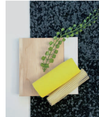
brandherm & krumrey erstellten ein ästhetisches Moodboard.