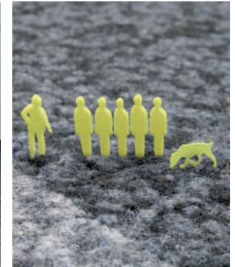
Statement von Supergelb Architekten: Einfach toll!