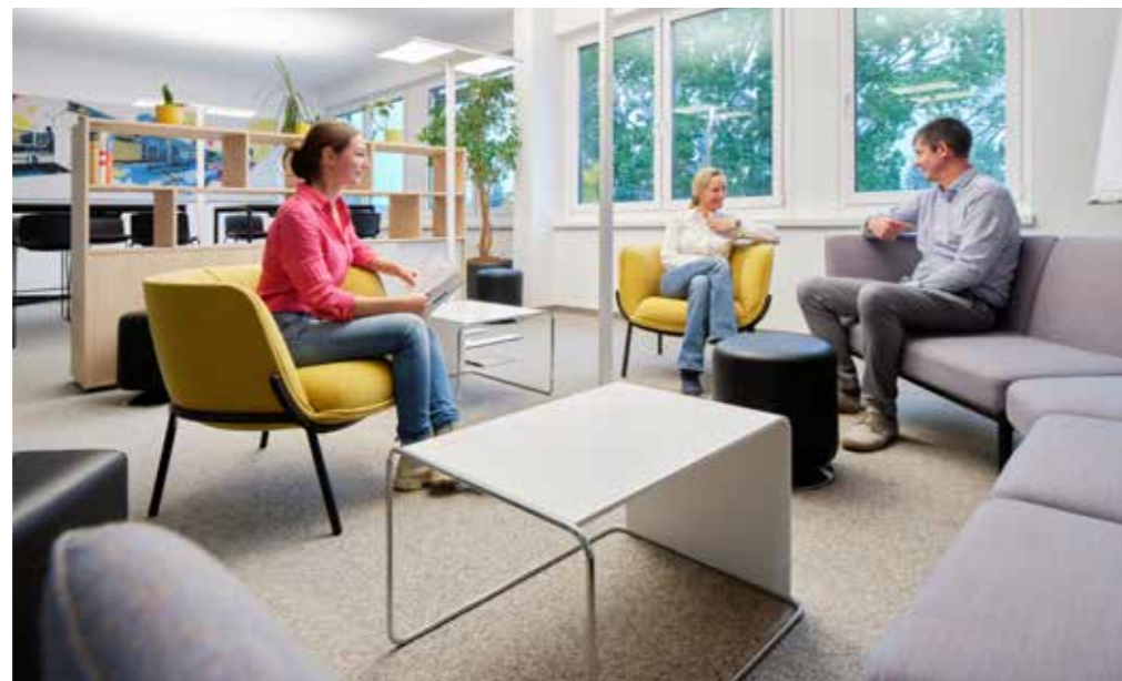
oben links: Die Büros wurden bei Frequentis an moderne Arbeitsweisen angepasst.