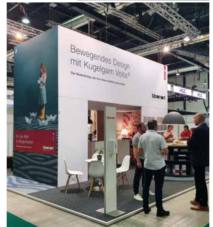
So präsentiert sich die Fabromont AG in 2023.