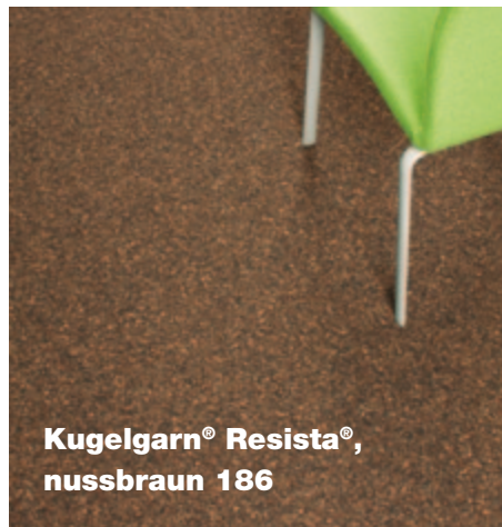
Kugelgarn® Resista®, nussbraun 186

Kugelgarn® ist ein textiler Bodenbelag, der den Status einer eigenständigen Kategorie innerhalb der textilen Bodenbeläge neben Webware, Tufting und Nadelfilz besitzt. Die Besonderheit liegt